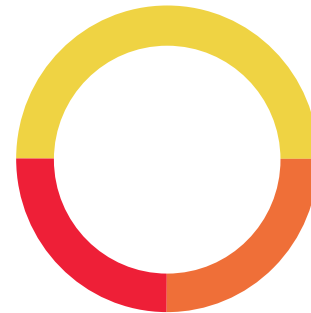
ENLACE GLOBAL PM C/INTERESES (Saldo inicial de $18,928.07)